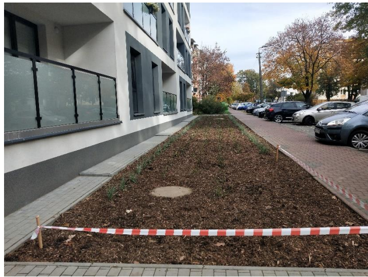
i po nasadzeniach