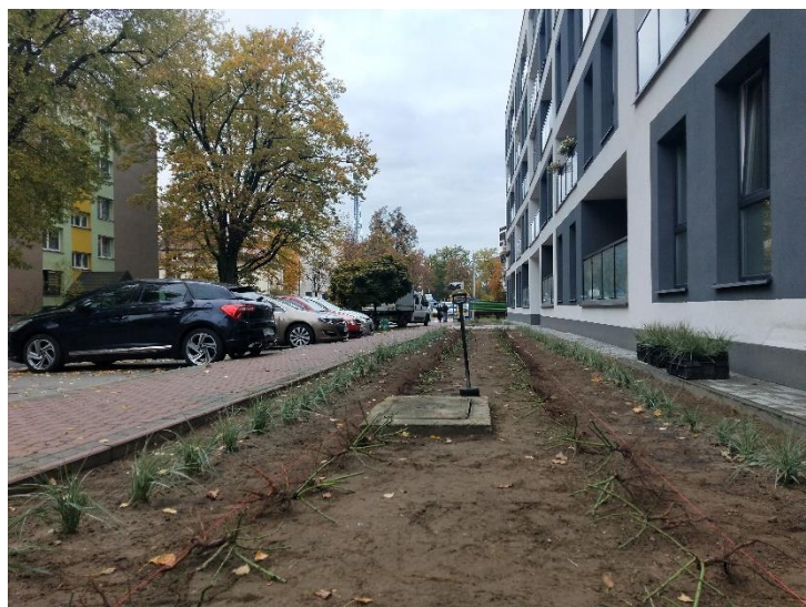
i w trakcie nasadzeń