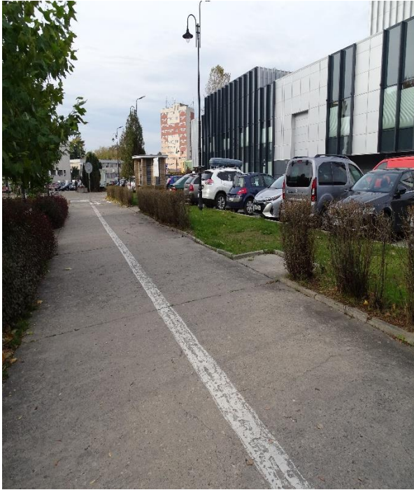
Stan sprzed inwestycji