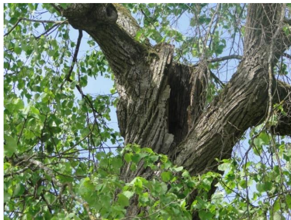
1. Lipa drobnolistna w ul. Parkowej.