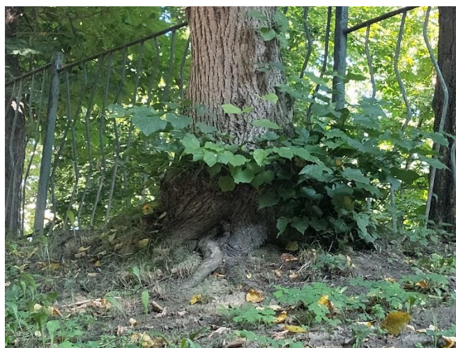
3. Lipa drobnolistna w ul. Głębokiej