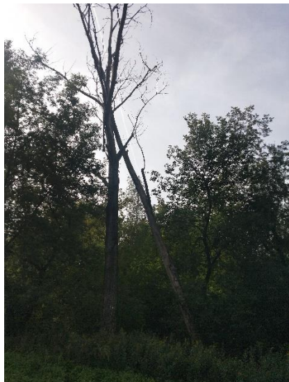
9. Topola w ul. Budowlanych