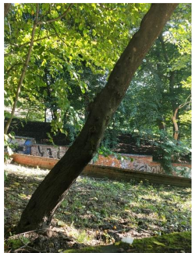
4. 5. Śliwy ałyce w ul. Głębokiej