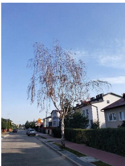
8. Brzoza brodawkowata w ul. Norblina