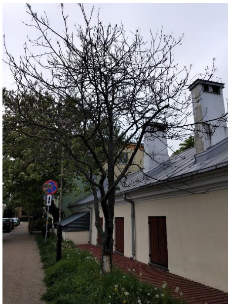
6. Jarzab pospolity w ul. Waryńskiego