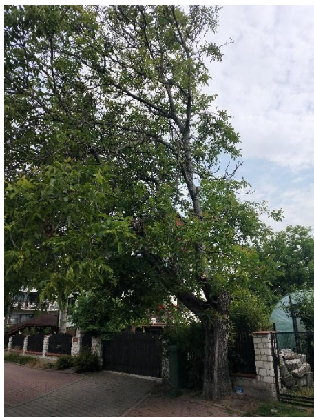
7. orzech włoski w ul. Krzywej