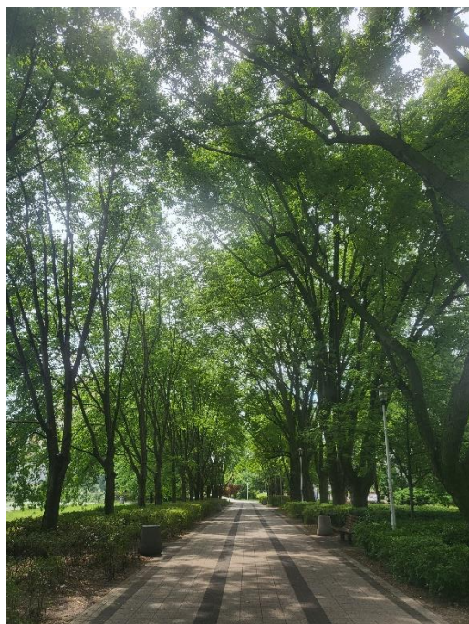
Stan przed zabiegami