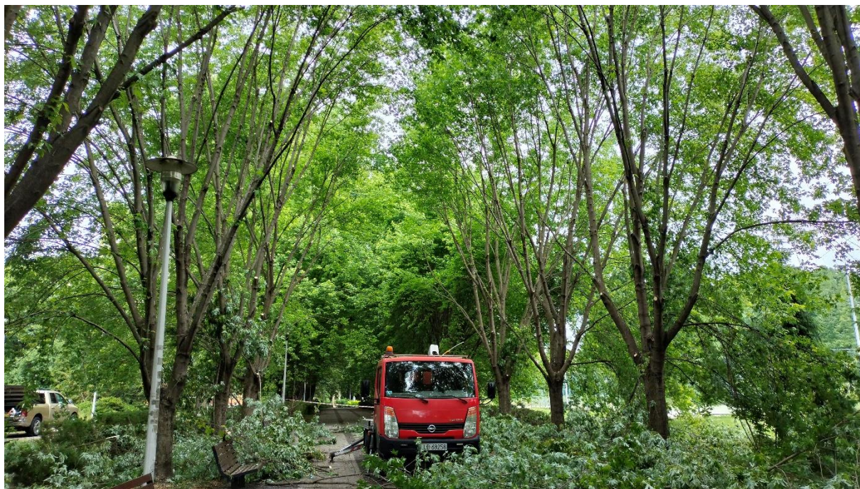
Prace przy prześwietleniu drzew klonu srebrzystego w alei Parku Solidarności

sędziwe, rosnące na terenach zabytkowych oraz pomniki przyrody. Wykonawcy zlecenia wylaniani są w postępowaniach przetargowych prowadzonych zgodnie z zasadami ustawy 'Prawo zamówień publicznych'. Środki na prace pielęgnacyjne drzewostanu komunalnego pochodzą z budżetu Miasta Puławy. Zasadą jest, że wszystkie prace pielęgnacyjne drzewostanu prowadzone są pod specjalistycznym nadzorem inspektorskim.